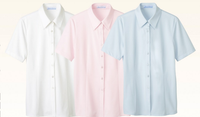
8 (ホワイト) 3 (ピンク) 9 (サックス)