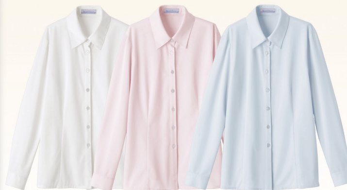
8 (ホワイト) 3 (ピンク) 9 (サックス)

長袖ブラウス SA051B 上代：¥7,400 (税抜) 半袖ブラウス SS052B 上代：¥6,800 (税抜) ニットトリコット ポリエステル 100%